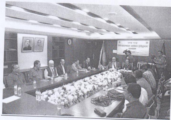
২০২০-২০২১ সালে উত্তাবনী মেলার উদ্বোধনী অনুষ্ঠান।